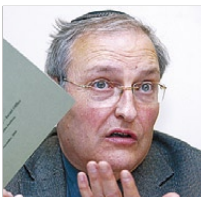
▶▶ Efraim Zuroff.

«Ofrecemos una recompensa a quien nos dé información que lleve a la ubicación y castigo de criminales nazis, empezamos hace 10 años en los países bálticos (Estonia, Letonia y Lituania) y seguimos en Polonia, Rumanía, Austria, Croacia, Hungría,